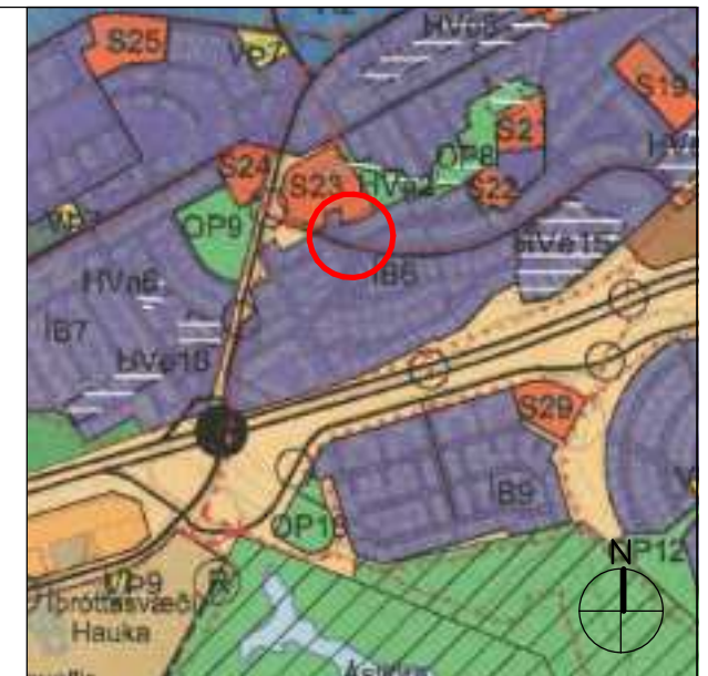
YFIRLIT- HLUTI AÐALSKIPULAGS HAFNARFJ. 2013 - 2025

Lóðin við Lækjarhvamm 1 verður stækkuð til suðurs og suð-vesturs.